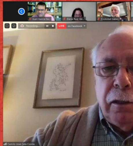
CAMILO JOSÉ CELA CONDE Antropólogo, Profesor Emérito de la Universidad de las Islas Baleares

La creatividad mueve el avance de la humanidad desde hace más de cuarenta mil años: desde las cuevas del sudeste asiático de Sulawesi y Wallacea o las del Cantábrico: Altamira, El Castillo y Tito Bustillo en España.